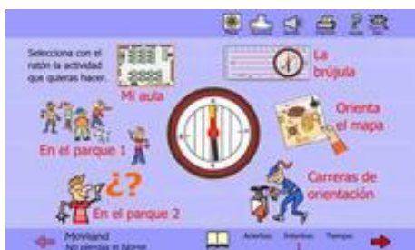
No pierdas el Norte